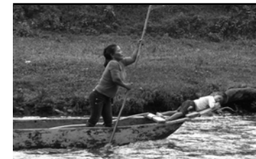
Documento consolidado con las propuestas temáticas de Mujeres Rurales para la formulación de políticas públicas y leyes