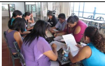
Documento consolidado con las propuestas temáticas de Mujeres Rurales para la formulación de políticas públicas y leyes

Regular la importación de semillas y crear bancos de semillas con participación activa de las mujeres.