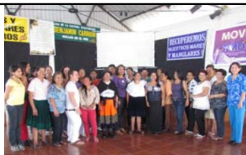
Documento consolidado con las propuestas temáticas de Mujeres Rurales para la formulación de políticas públicas y leyes

El Estado, como garante de derechos, deberá considerar la obligación legal de reconocer los derechos de la diversidad de nosotras las mujeres indígenas, mestizas montubias, afrodescendientes y campesinas y tomar medidas para