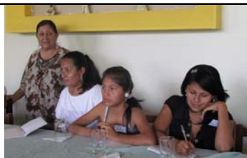
Documento consolidado con las propuestas temáticas de Mujeres Rurales para la formulación de políticas públicas y leyes

Que se cumpla la alternabilidad en la elección de alcaldes, donde la vicealcaldesa debe ser mujer.