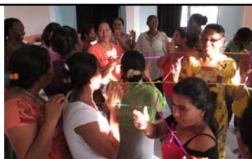
Documento consolidado con las propuestas temáticas de Mujeres Rurales para la formulación de políticas públicas y leyes

Ofrecer a las mujeres rurales que no tienen tierra el acceso preferente a la propiedad o tenencia de predios expropiados. Actualizar regularmente los censos y poner a disposición de las mujeres esta información.