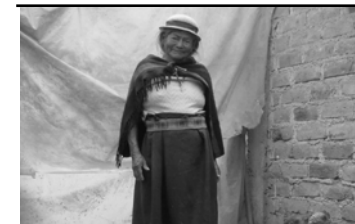
Documento consolidado con las propuestas temáticas de Mujeres Rurales para la formulación de políticas públicas y leyes