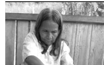
Documento consolidado con las propuestas temáticas de Mujeres Rurales para la formulación de políticas públicas y leyes