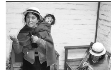
Documento consolidado con las propuestas temáticas de Mujeres Rurales para la formulación de políticas públicas y leyes