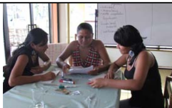
Documento consolidado con las propuestas temáticas de Mujeres Rurales para la formulación de políticas públicas y leyes

Las mujeres rurales proponemos que los Gobiernos Autónomos Descentralizados, inclusive a nivel parroquial, tengan competencias de control pesquero, con participación de las mujeres, como acción afirmativa.