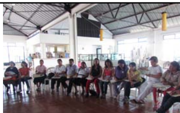
Documento consolidado con las propuestas temáticas de Mujeres Rurales para la formulación de políticas públicas y leyes

Garantizar a las viudas la propiedad de bienes en casos de herencia, que es violentada por hijos y otros familiares; igual en caso de separación, donde el reclamo de sus derechos es usurpado -incluso por otras mujeres-, por cuanto la propiedad de la tierra, del agua y otros recursos naturales y tecnológicos son indispensables para la preservación de la vida en el contexto rural.