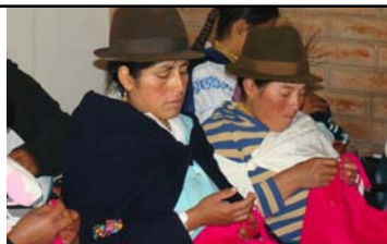
Documento consolidado con las propuestas temáticas de Mujeres Rurales para la formulación de políticas públicas y leyes

Número de mujeres rurales que realizan actividades productivas y que tienen a su cargo el sostenimiento de sus hijos u otros dependientes;