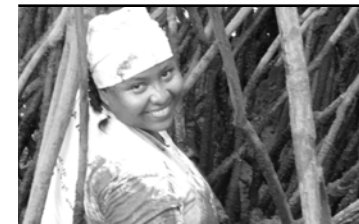
Documento consolidado con las propuestas temáticas de Mujeres Rurales para la formulación de políticas públicas y leyes