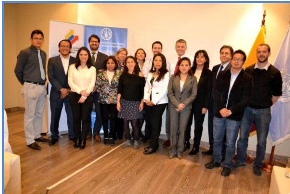
Foto: participantes del taller proyecto TCP/RLA/3301.

Este 20 y 21 de mayo, representantes de los países andinos Argentina, Bolivia, Colombia, Chile, Ecuador y Perú se reunieron en el hotel Reina Isabel de la ciudad de Quito, con el objetivo de analizar información y experiencias conjuntas sobre la conservación sostenible de las montañas en la región andina.