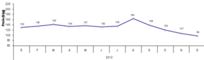
Precio del maíz blanco a nivel nacional en el 2012