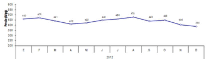
Precio del frijol a nivel nacional en el 2012