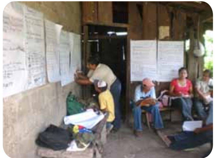
Tabla comparativa para priorizar rubros.

Acorde con la tabla anterior, de las diferentes actividades económicas o rubros, los y las participantes priorizarán los cultivos; ahora, para conocer cuál de los cultivos es prioritario, se realiza nuevamente un procedimiento similar, ubicando tanto en las columnas como en las filas los cultivos referidos por los y las participantes; se procede de la misma manera, señalando las coincidencias, se contabilizan las frecuencias y con base en ello se determina la prioridad.