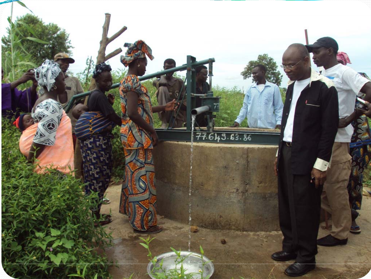
Visite de terrain: Petite Hydraulique villageoise – Les Puits à Ker Set Peul