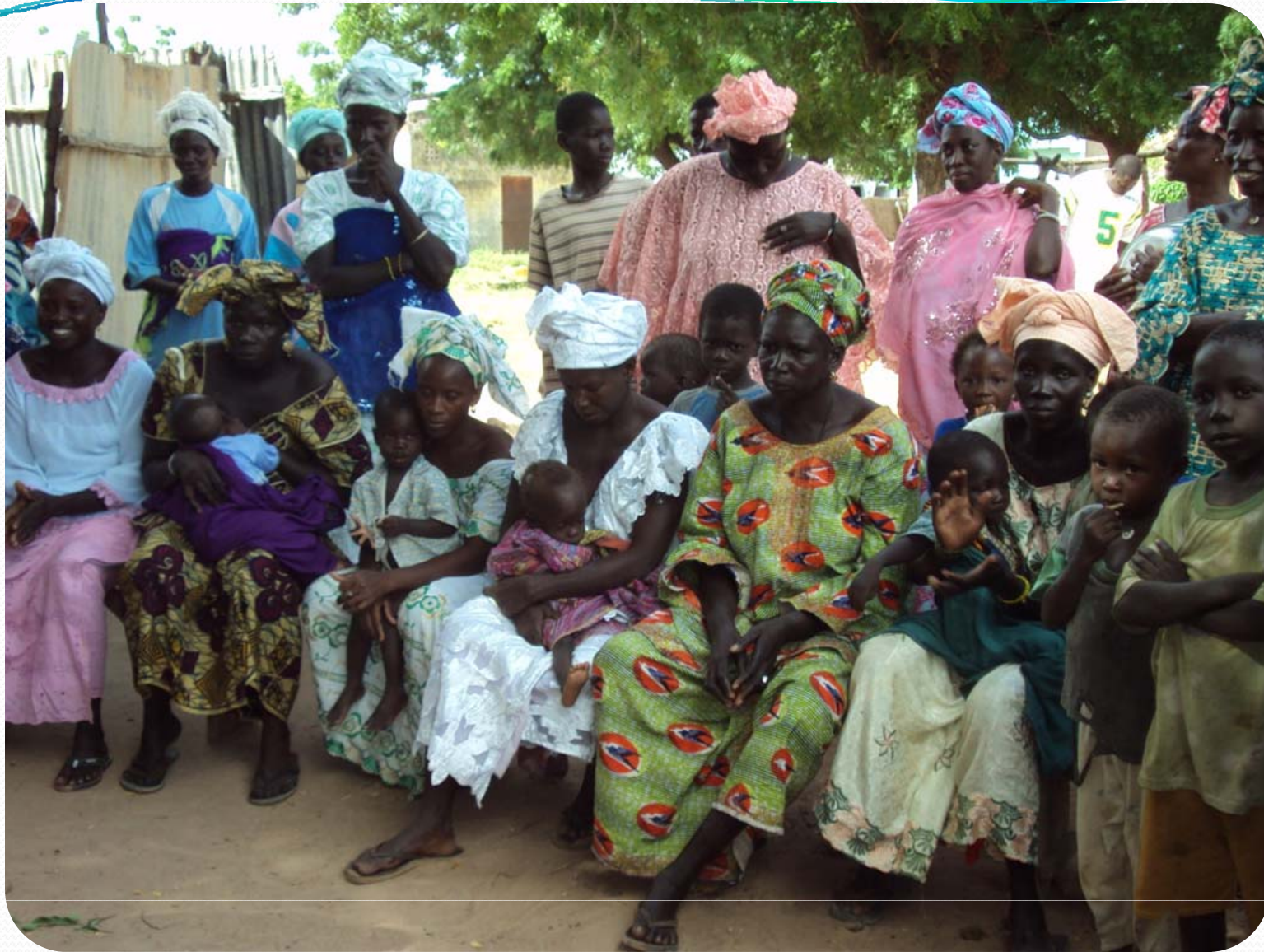
Visite de terrain: Petite Hydraulique villageoise – Ker Set Wolof