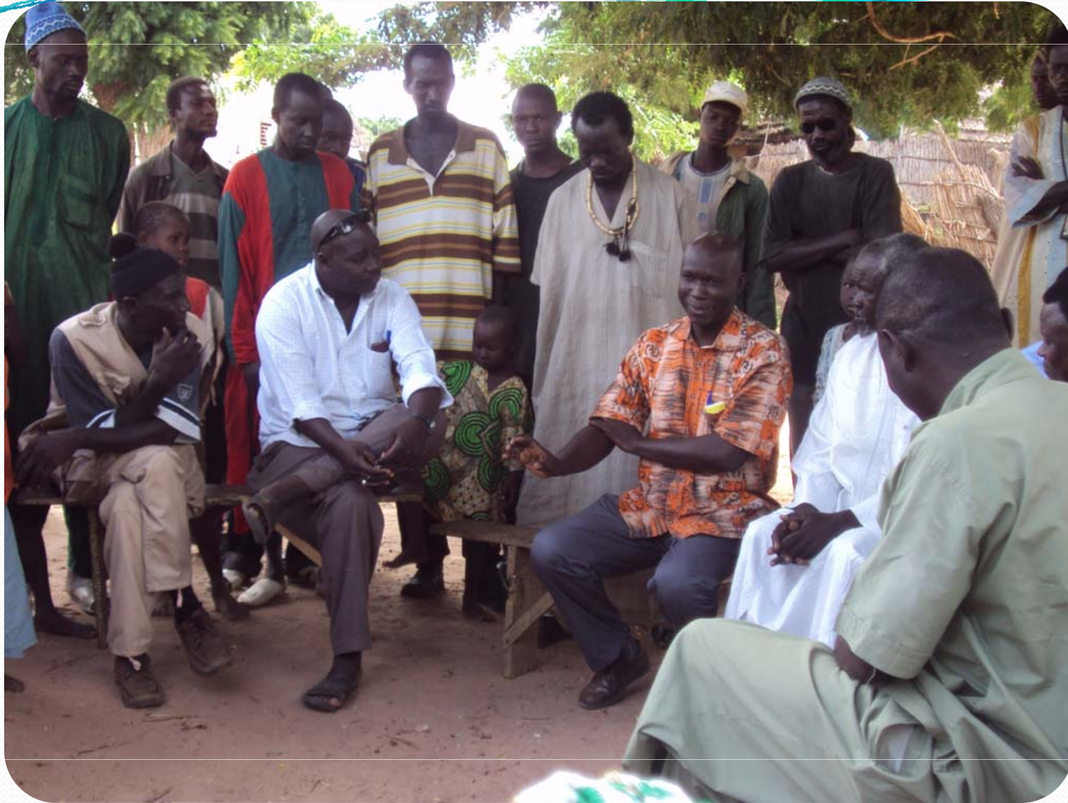
Visite de terrain: Petite Hydraulique villageoise – Ker Set Wolof