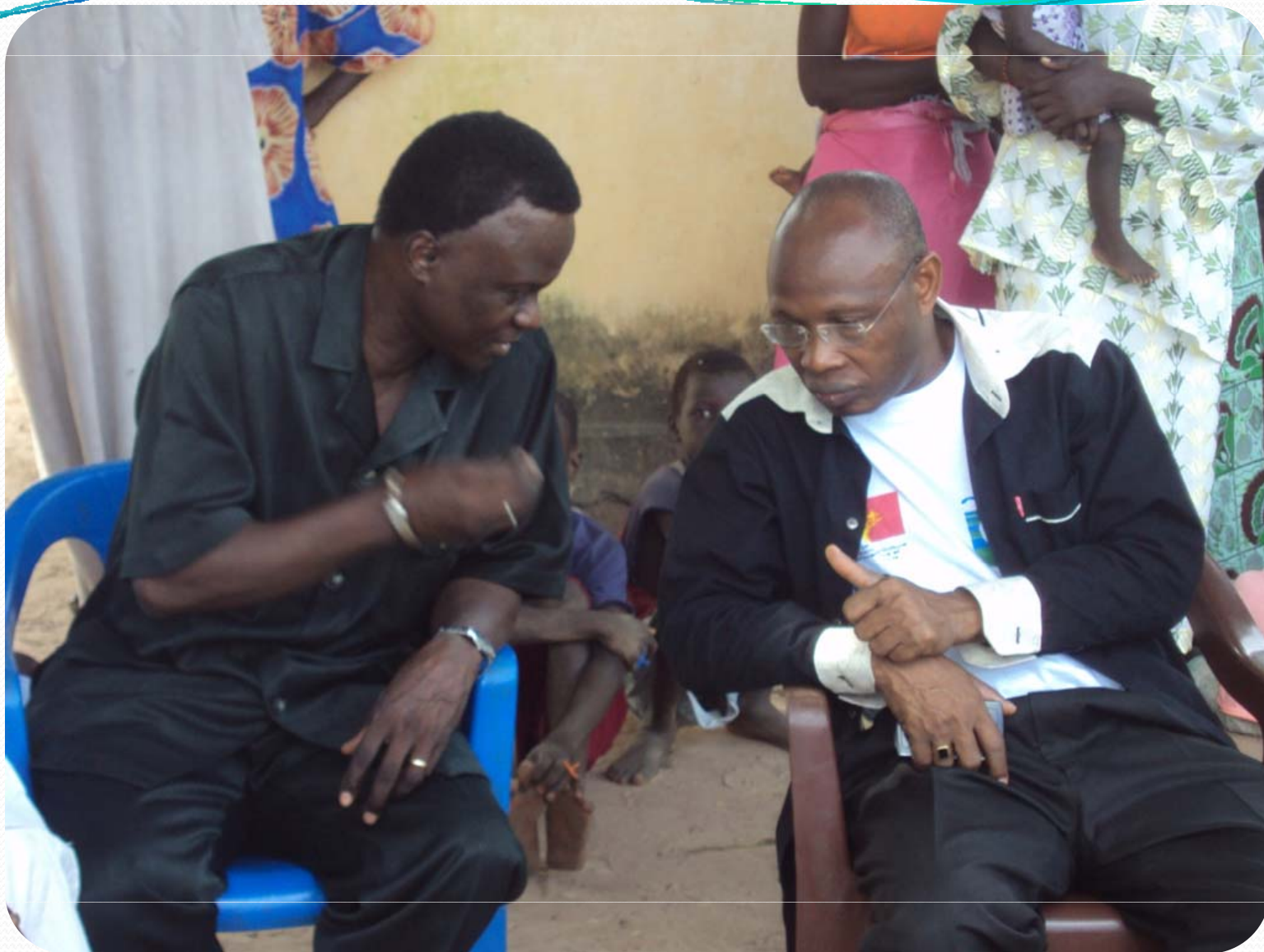
Visite de terrain: Petite Hydraulique villageoise – Keur Set Wolof