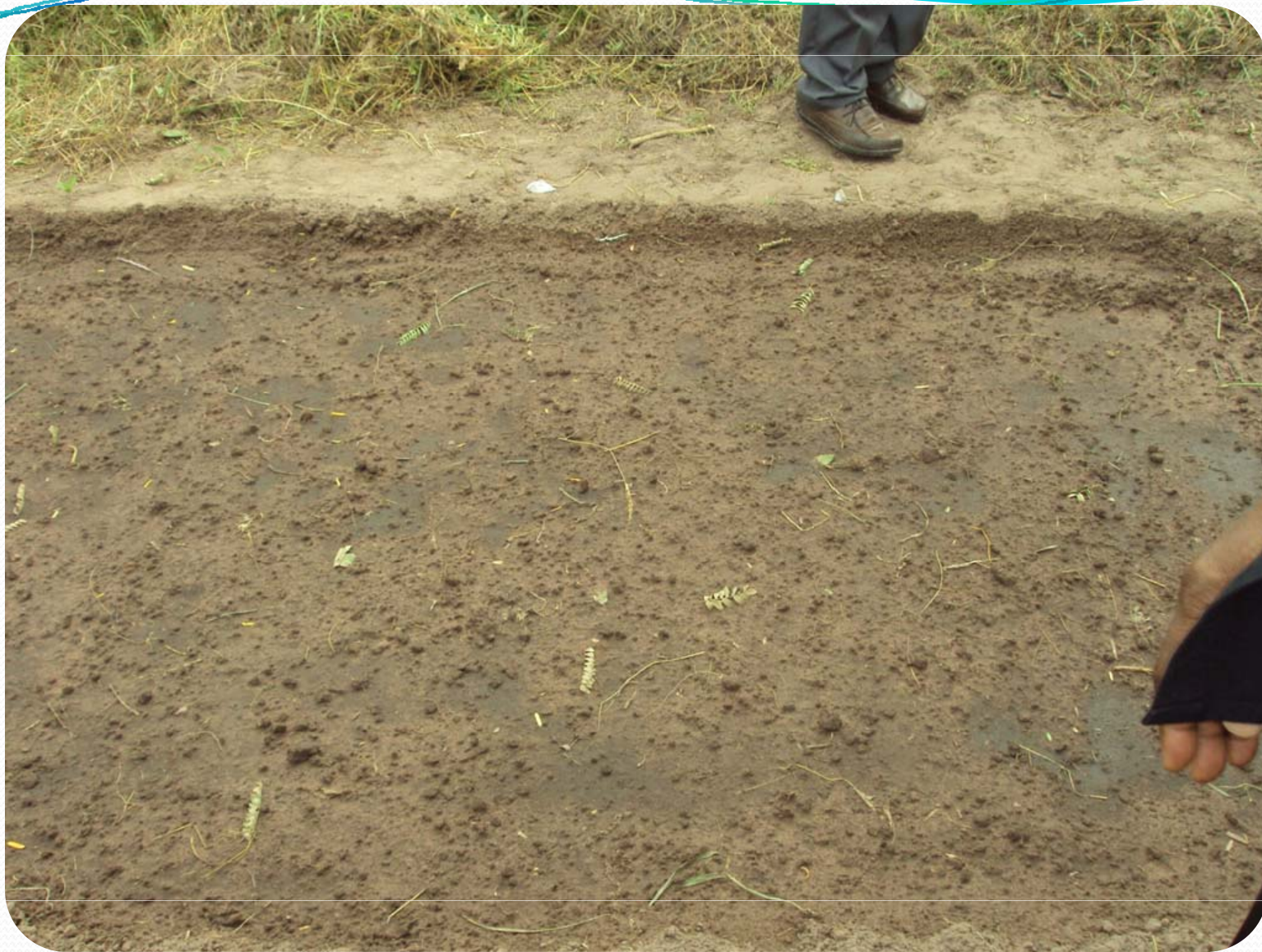
Visite de terrain: Petite Hydraulique villageoise – Ker Set Peul – Parcelle de Laitue