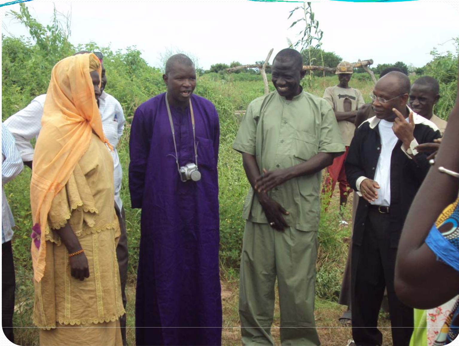
Visite de terrain: Petite Hydraulique villageoise – Ker Set Peul