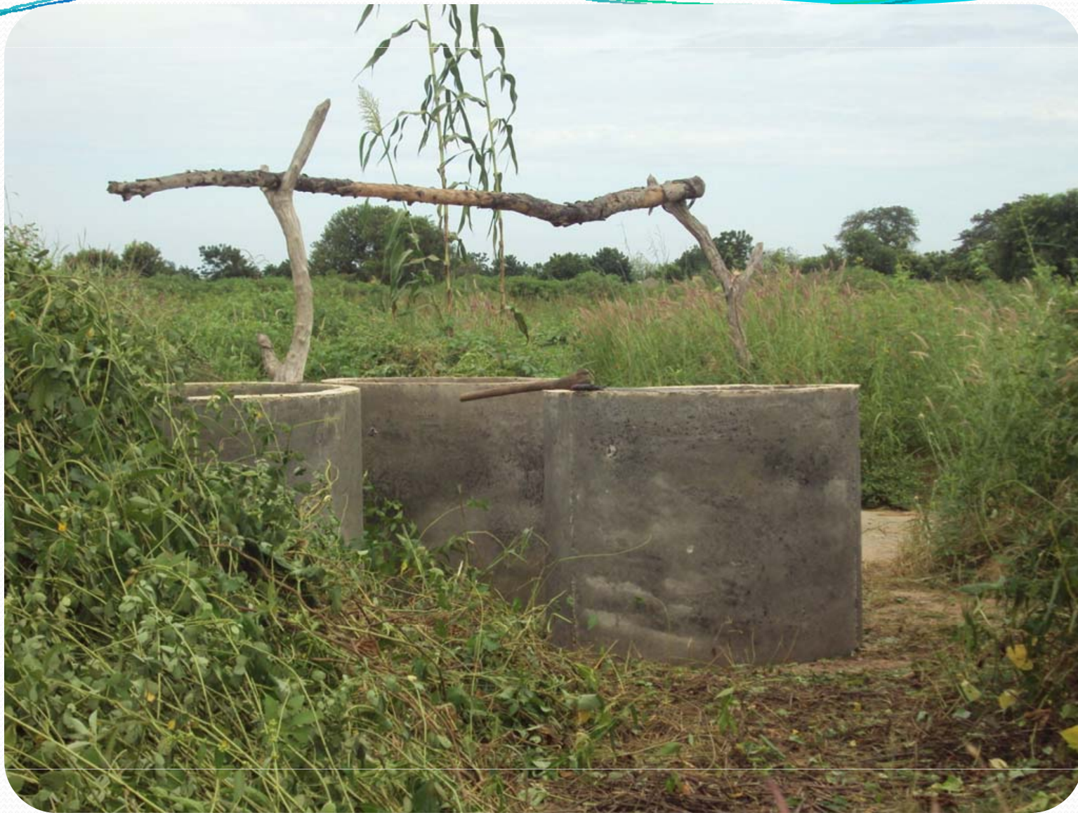
Visite de terrain: Petite Hydraulique villageoise – Les Puits à Ker Set Wolof