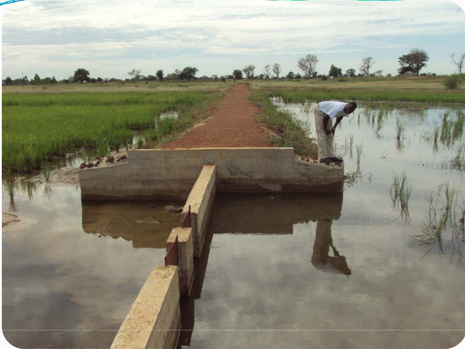
Visite de terrain; Petite Hydraulique villageoise – Site de Ndioudiouf – Champs de riz