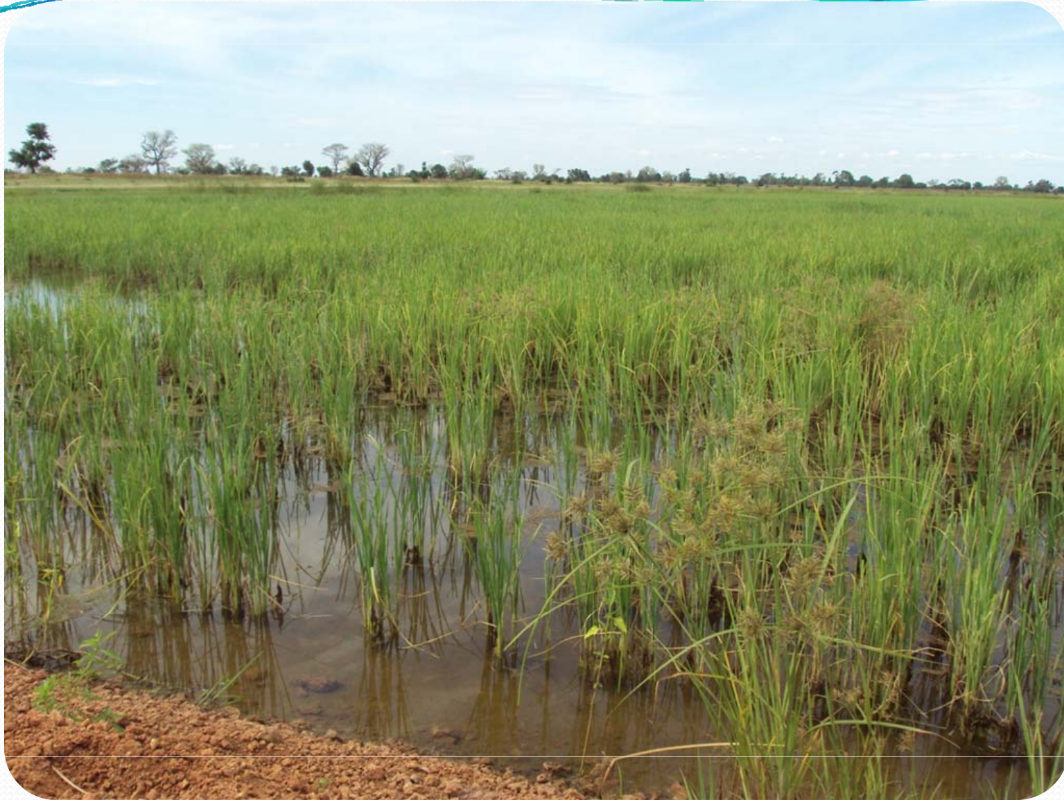
Visite de terrain: Petite Hydraulique villageoise – Site de Ndioudiouf – Champs de Riz