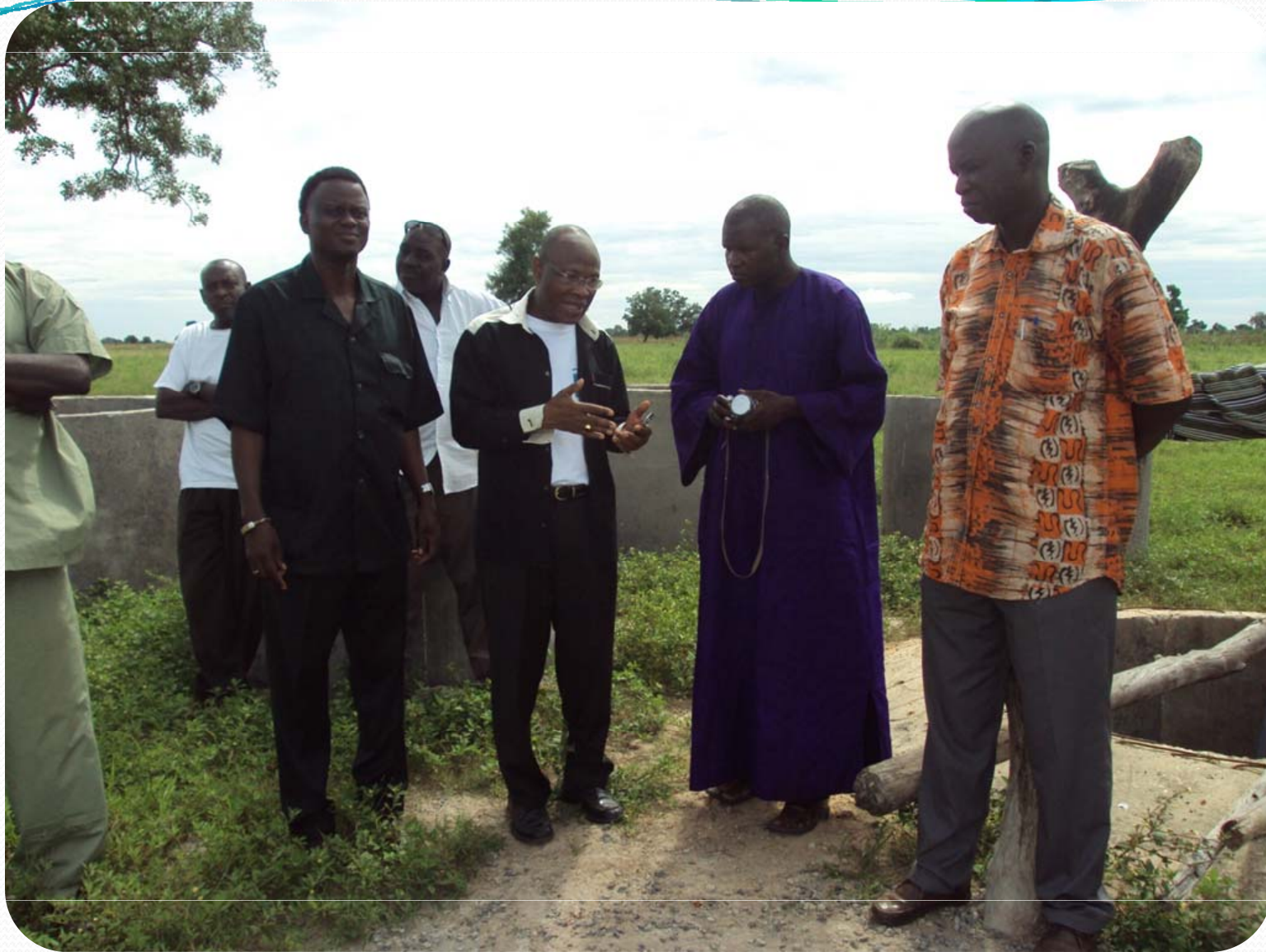
Visite de terrain: Petite Hydraulique villageoise – Les Puits à Ker Set Wolof