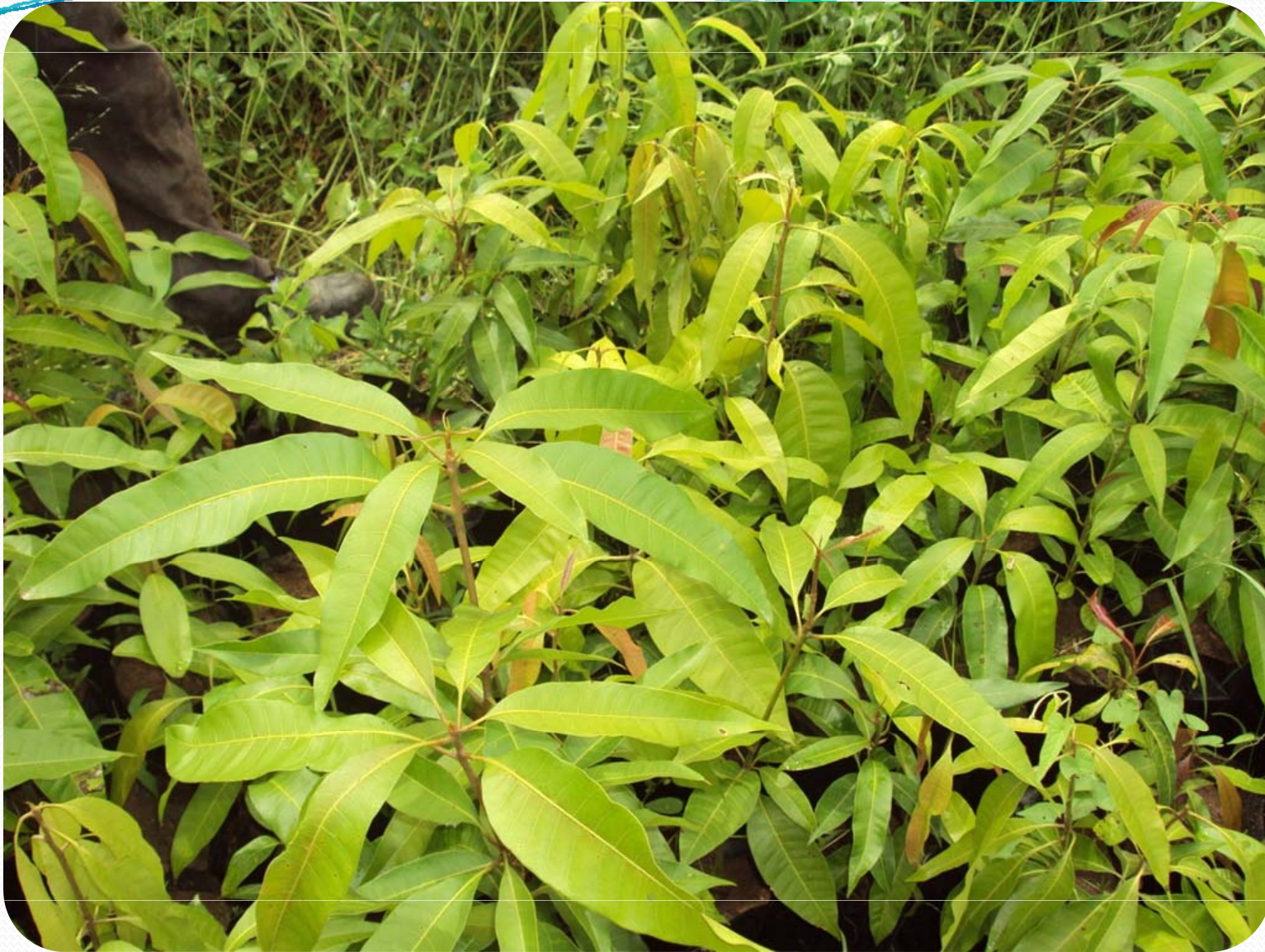
Visite de terrain; Petite Hydraulique villageoise – Ker Set Peul- Pepinière de manguiers