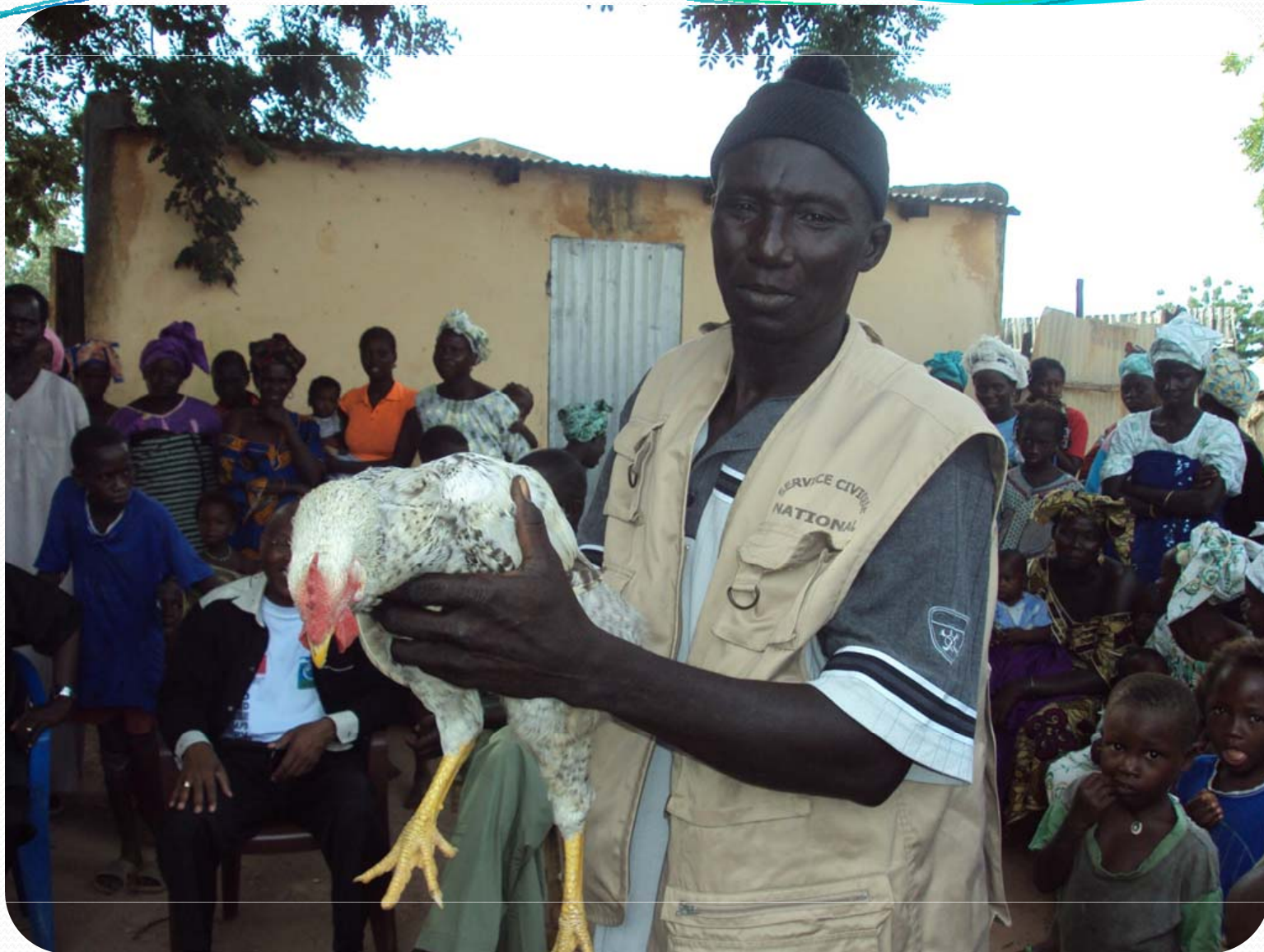
Visite de terrain; Petite Hydraulique villageoise – Ker Set Wolof