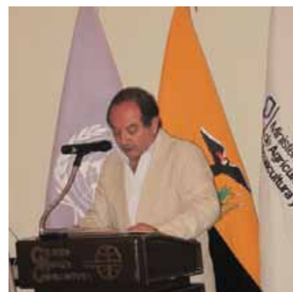
Ministro de Agricultura, Ganadería, Acuacultura y Pesca, Soc. Javier Ponce Cevallos

Las palabras de bienvenida del Sociólogo Javier Ponce Cevallos, Ministro de Agricultura, Ganadería, Acuacultura y Pesca; recalcaron que "El MAGAP ha implementado un ambicioso programa de inclusión de temas de adaptación y mitigación al cambio climático que van de la mano con la construcción, conjuntamente con otros Ministerios, de una Estrategia Nacional de Cambio Climático" .